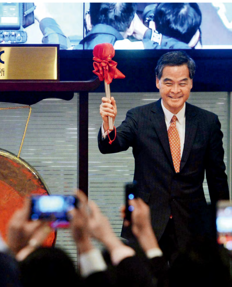
2016年12月5日,香港特别行政区行政长官梁振英(右)和港交所主席周松岗共同鸣锣开市,庆祝“深港通”正式启动

从“十三五规划”开始,历经“十一五规划”、“十二五规划”、“十三五规划”逐步递进,中央政府把香港特区“保持长期繁荣稳定”问题有机纳入国家整体发展战略的大框架中。2016年出台的“十三五规划”,继“十二五规划”之后第二次将涉及香港特区“一国两制”建设的内容单独成章,专门论述“支持香港巩固传统