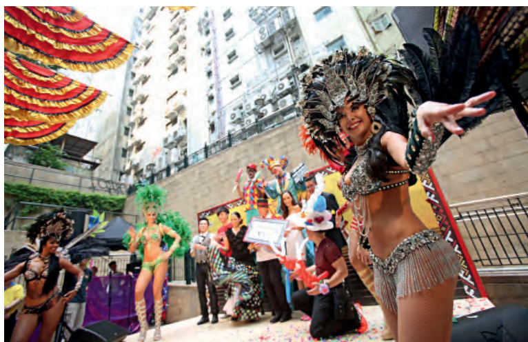
香港中环街区遍布古迹、庙宇、老字号、餐厅和酒吧，中西古今，传统与创意，繁华与宁静，完美并存。图为著名兰桂坊每年一度举办兰桂坊节，热闹非凡

香港的营商环境在回归20年中一直保持着良好势头。在世界银行对全球185个经济体营商环境的排名中，香港多年位居前列。根据联合国贸易和发展会议《2013年世界投资报告》，香港在吸收外来直接投资方面位居全球第三位。在瑞士洛桑国际管理发展学院《世界竞争力年报》排名中，香港多年来都被评为全球最具竞争力经济体之一。“美国传统基金会连续22年评选香港为全球最自由的经济体。美国智库卡特研究所2016年公布‘2016年人类自由指数’排名，按法治、行动自由、公民自由、经济自由等79项指标，对全球159个国家及地区作出评估，香港连续6年排名第一。”