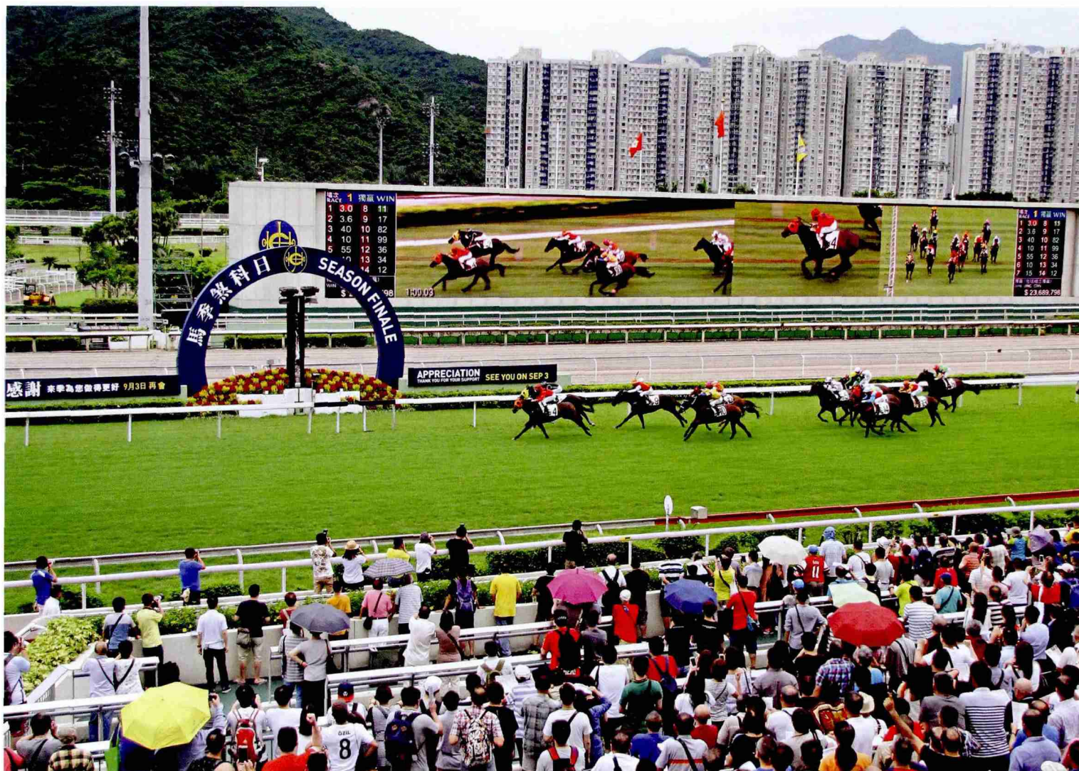
香港市民在沙田马场观看赛马活动。在基本法保障下，香港居民原有的生活方式保持不变

优势、培育发展新优势”的问题，并对未来香港特区的经济发展的努力方向提出了明确寄望。对此，国家主席习近平明确指出：“希望特别行政区政府带领香港社会各界凝聚发展共识，着力发展经济、改善民生、促进和谐，同时抓住国家制定‘十三五规划’、实施‘一带一路’建设等带来的机遇，进一步谋划和推进香港长远发展。”