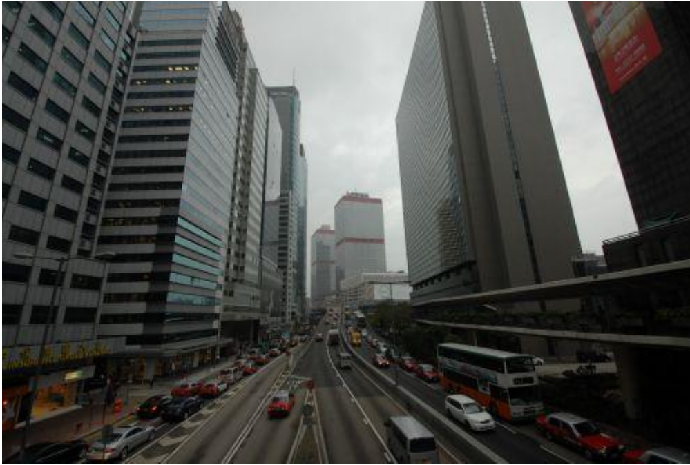
香港信德中心。

发展经济 ,切实有效改善民生 ,循序渐进推进民主 ,包容共济促进和谐”的工作出现了新的进展、新的气象。