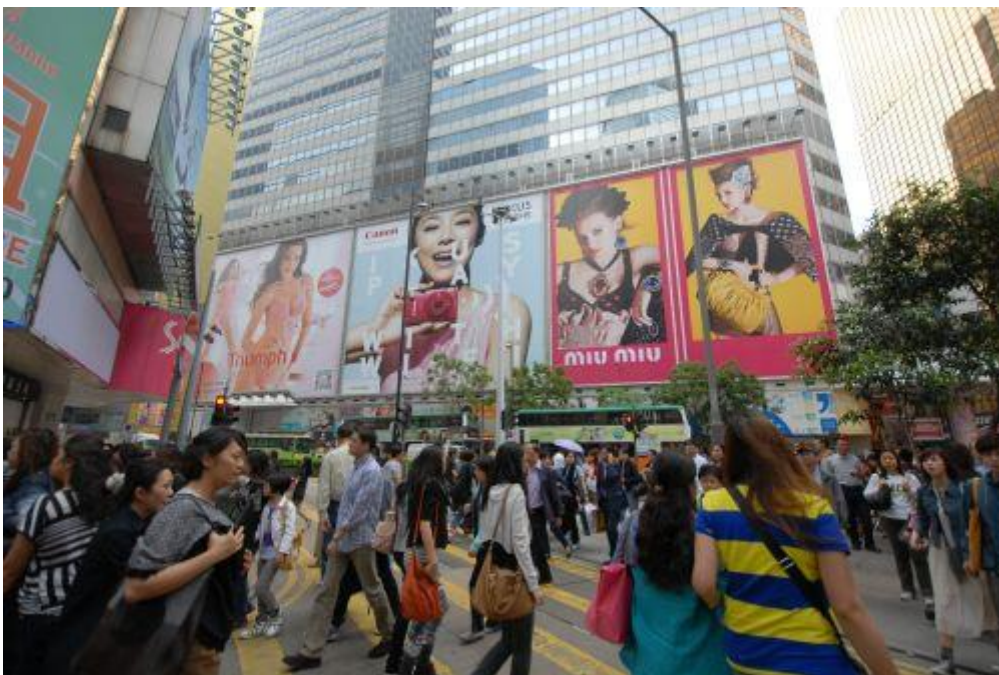
香港铜锣湾。

计”和“底线思维”寸步不让，始终奉行“两个坚定不移”的基本立场。一方面，坚定不移地支持以“双普选”为目标指向和主要内容的香港特区政制改革和民主化进程，直至“双普选”的美好愿景在香港特区成为活生生的现实；另一方面，坚定不移地支持以香港基本法和全国人大有关决定的规定为基础的正确方向，直至“一国两制”方针政策在香港特区得以全面准确的理解认识和贯彻落实。表现出了高超的战略定力。